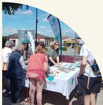
Fête de la biodiversité 2025 à Laroque-Timbaud