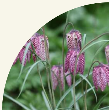
Fritillaire pintade ( Fritillaria meleagris ) sur le site du Moulin de la Ville à Tombeboeuf

Avec son Point Info Biodiversité , le CPIE met en œuvre des projets de préservation et de restauration de la biodiversité locale , à travers des actions aussi variées que des diagnostics écologiques, plans de gestion, conseils naturalistes ou inventaires faune-flore. Pionnier en la matière, il mène chaque hiver des programmes de plantation de haies champêtrées et gère également 3 espaces naturels dont l'intérêt environnemental est reconnu.