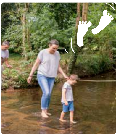
Réveille tes pieds: le toucher autrement...

des aventures pour réveiller vos 5 sens !