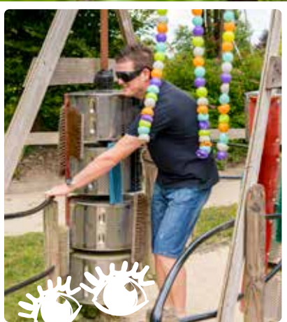
Active tes sens: Cap' de marcher sans la vue?