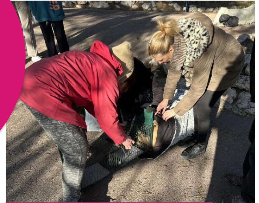
Campagnes de stérilisation de chats errants