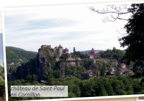
Château de Saint-Paul en Cornillon