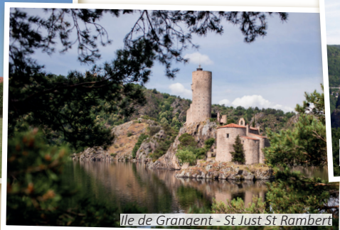
Ile de Grangent - St Just St Rambert