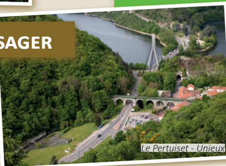
Le Pertuiset - Unieux

Acquisitions / cessions foncières et immobilières justifiées d'un point de vue patrimonial