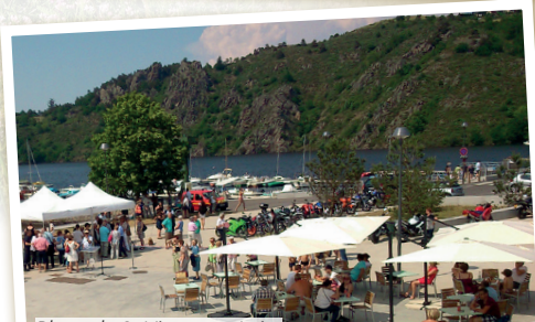
Plage de St Victor sur Loire