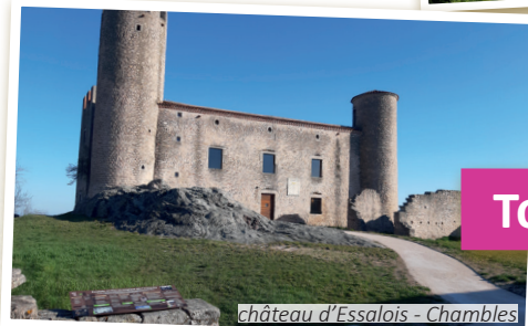
Château d'Essalois - Chambles