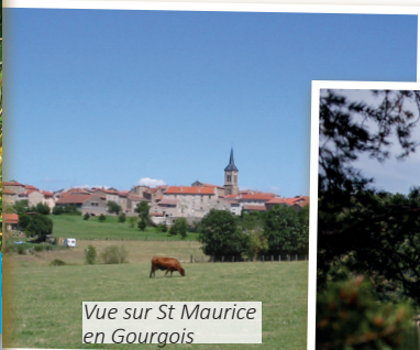
Vue sur St Maurice en Gourgois

Enlèvement des embâcles et corps flottants pouvant être prélevés mécaniquement, dans le cadre du conventionnement avec Electricité de France, concessionnaire du plan d'eau auprès de l'Etat