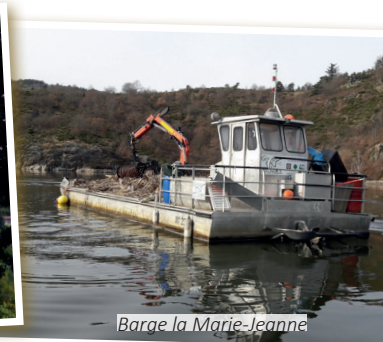
Barge la Marie-Jeanne