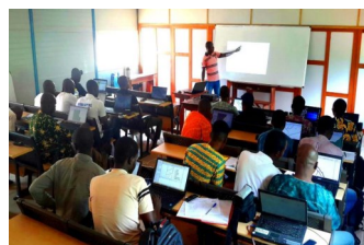
Education et renforcement de capacités