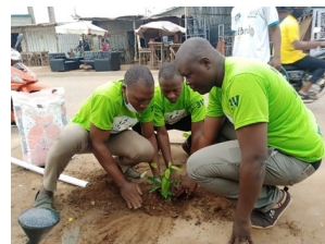
Changements climatiques et désertification