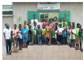
Gestion durable de l'environnement