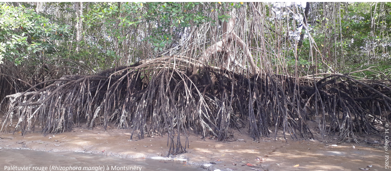
Palétuvier rouge ( Rhizophora mangle ) à Montsinéry

les préparent de plusieurs façons, citons entre autres la tarte aux huîtres, le court-bouillon aux huîtres, le colombo aux huîtres, la pimentade aux huîtres ou encore les huîtres grillées.