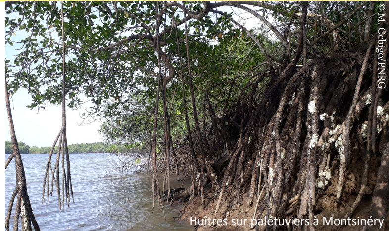
Huîtres sur palétuviers à Montsinéry

Les huîtres creuses aiment les cours d'eau salée à saumâtre c'est-à-dire en général les estuaires ou fleuves subissant l'influence de la marée. Adultes, elles peuvent se fixer sur différents types de supports : sur les racines de palétuviers rouge Rhizophora mangle Linné 1753, sur des roches (exemple de la Roche Maillard sur la rivière de Montsinéry), ou encore sur des argiles dures, lorsque ces dernières sont dans la zone intertidale c'est-à-dire la zone de balancement des marées, et qu'elles ne sont pas trop exposées au soleil à marée basse. Elles sont donc immergées la plupart du temps sauf à marée basse. L'optimum d'implantation se situe donc entre la ligne de mi-marée et le niveau d'implantation des racines des palétuviers dans la vase. Cette zone est donc parfois très réduite, surtout à proximité des berges non soumises aux marées et limite l'implantation des huîtres et donc le nombre de niches favorables à leur développement.