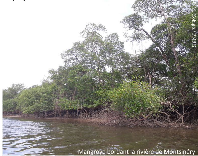
Mangrove bordant la rivière de Montsinéry

la création, d'une association regroupant les porteurs de projets.