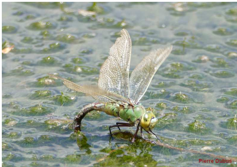
Anax empereur