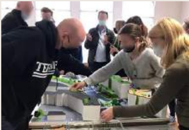
Maquette interactive sur la biodiversité en ville