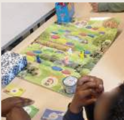
Jeu de plateau sur le thème du Hérisson d'Europe