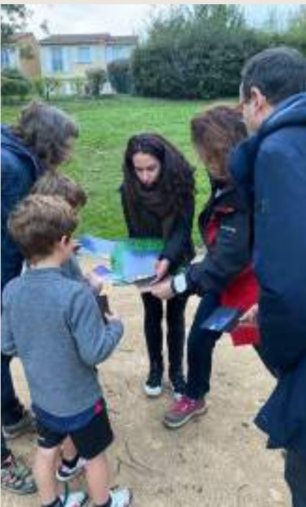
Animation grand public sur la pollution lumineuse