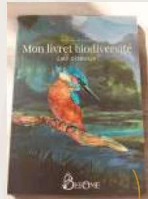
Livret d'apprentissage et d'activités sur les oiseaux (cycle de vie, alimentation, habitats, etc..)