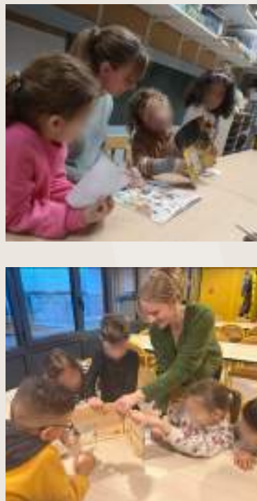
Animation élémentaire et maternelle sur le Hérisson