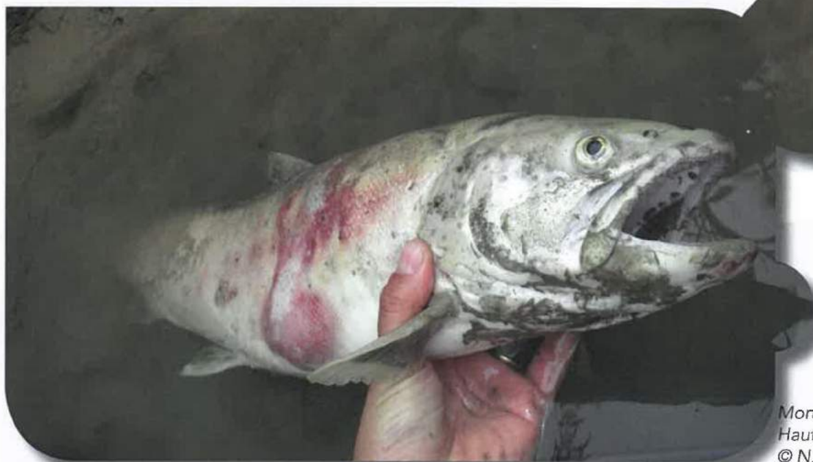
Mortalité Haute-rivière d'Ain