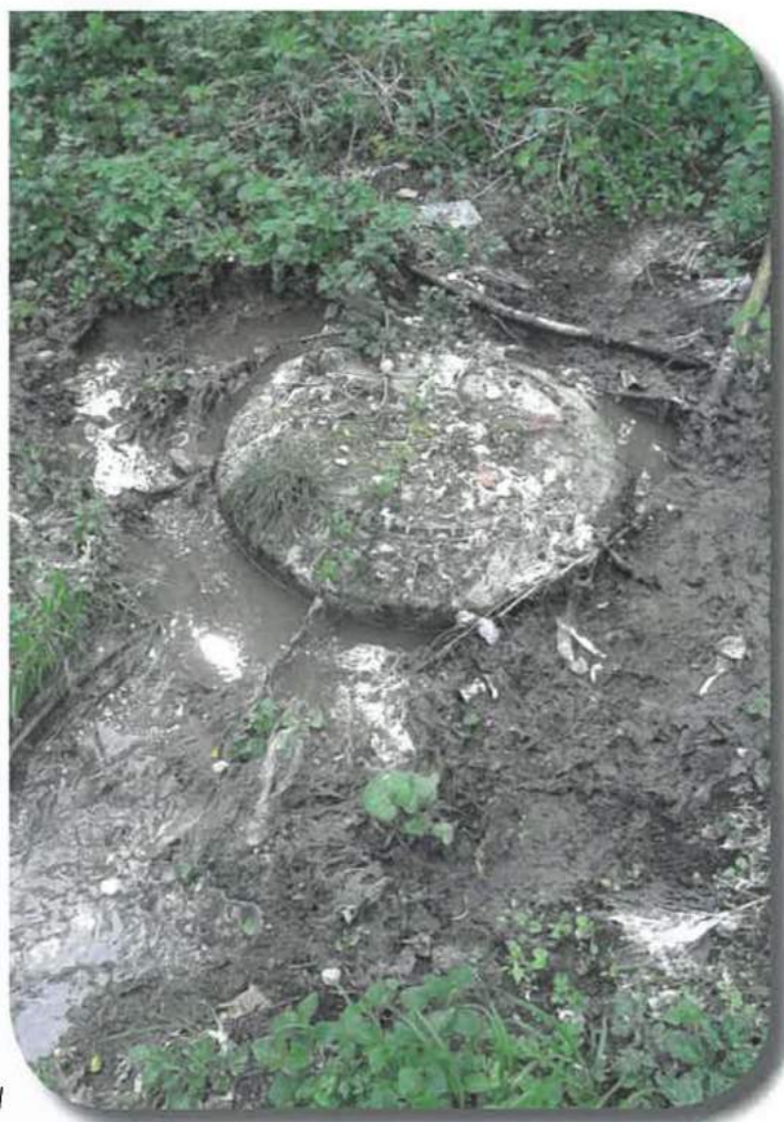
Débordement eaux usées Champagnole 2014