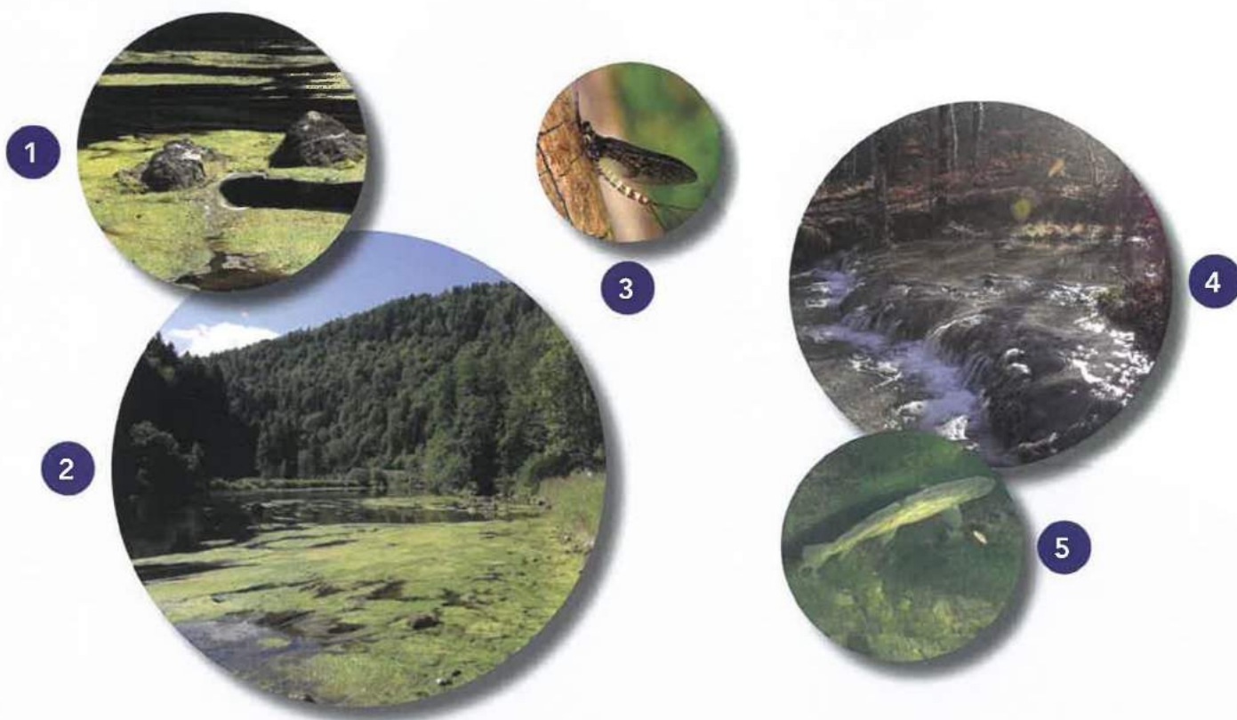
1 et 2. Eutrophisation du Doubs franco-suisse - 3. Ephémère danica - 4. Rû blanc indemne de toute pollution 5. Truite atteinte de Saprolégniose