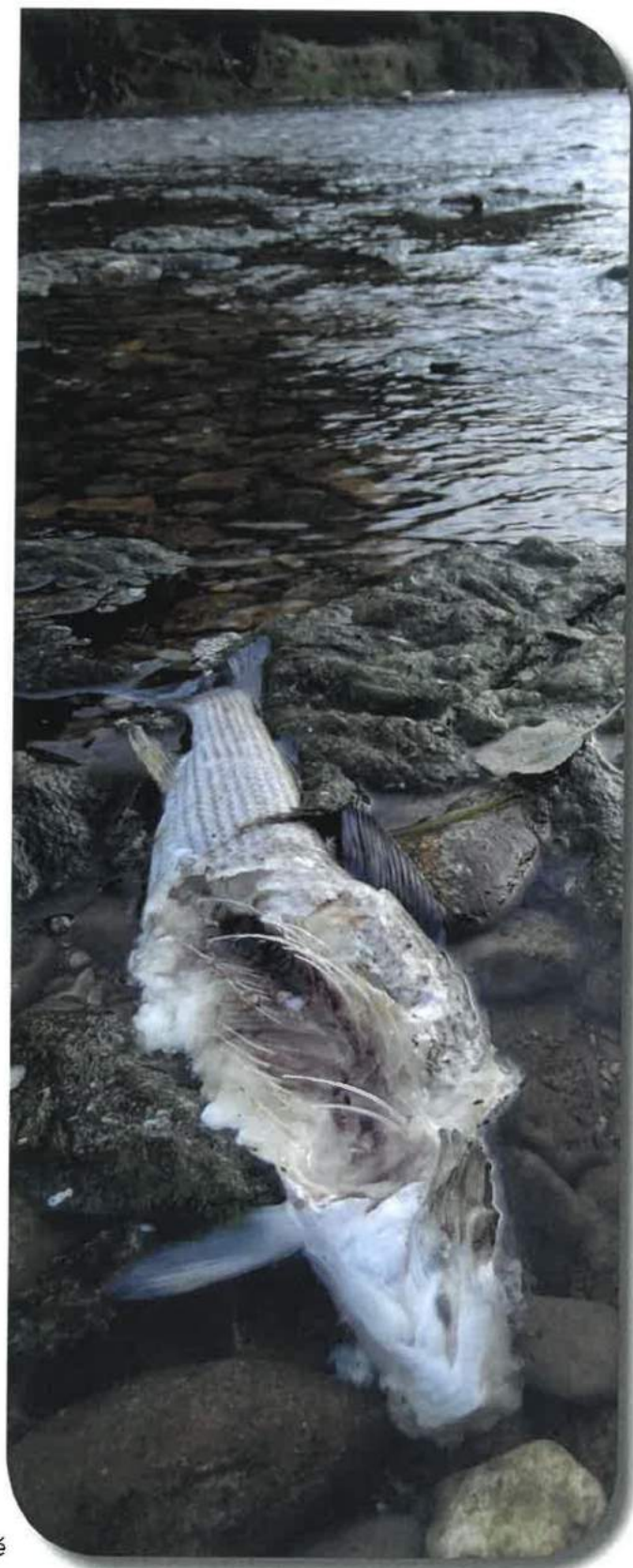
Mortalité Loue 2012