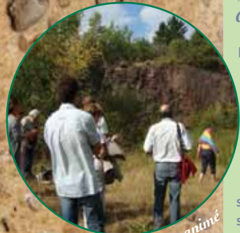
Circuit découverte animé