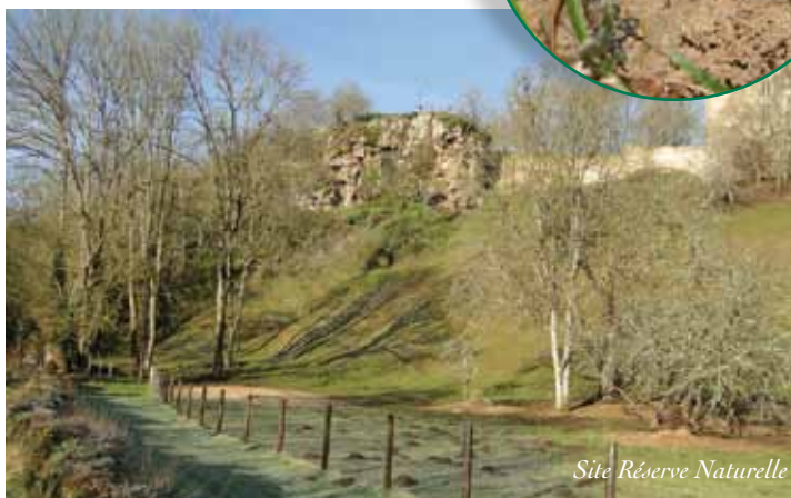
Site Réserve Naturelle