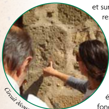
Circuit découverte animé

Les richesses de cette réserve naturelle sont avant tout géologiques : elles se caractérisent par un ensemble de roches, appelées « impactites » résultant de l'impact météoritique. Cet objet a laissé un cratère d'au moins 20 kilomètres de diamètre aujourd'hui effacé par les effets de l'érosion. Malgré l'usure, de nombreux témoins restent lisibles sur le terrain et sur un périmètre restreint d'où l'emploi du terme « astroblème » pour qualifier l'ensemble de ce territoire. Ces roches « témoins » ont été identifiées en fonction de leurs conditions de formation (pression, température) et de leur mode de mise en place (socle cataclasé en place, brèches de retombées).