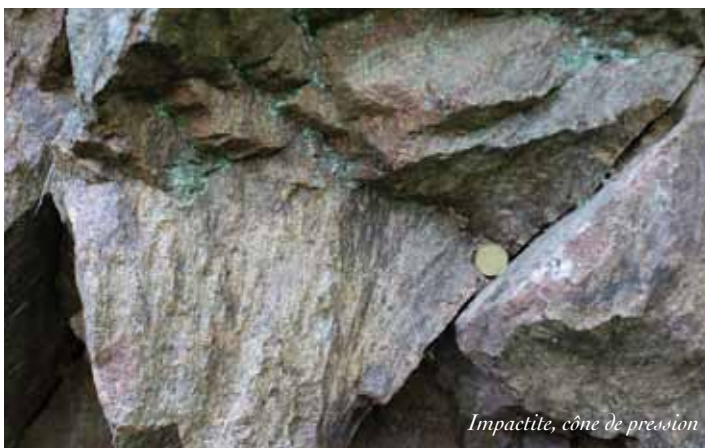
Impactite, cône de pression

Les espèces végétales et animales répertoriées (inventaire CEN Limousin de 2010) sont typiques de la campagne limousine. Notons toutefois la présence du Sonneur à ventre jaune ( Bombina variegata ) et de la Loutre d'Europe ( Lutra lutra ) sur certains sites ou à proximité immédiate, deux espèces protégées au niveau national faisant l'objet de programmes de sauvegarde.