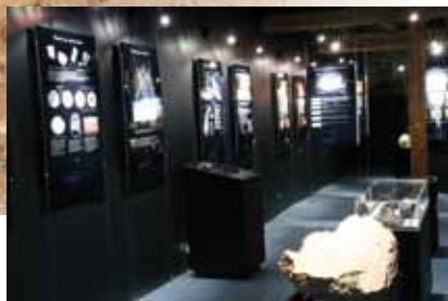
Maison de la Réserve Espace Météorite Paul Pellas