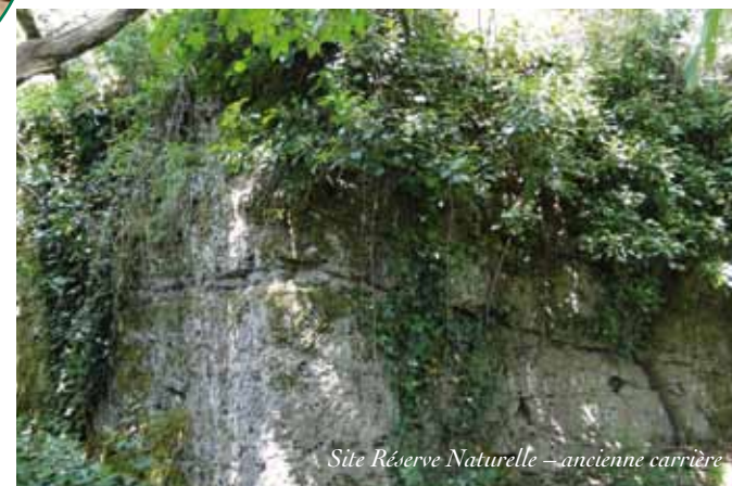
Site Réserve Naturelle – ancienne carrière