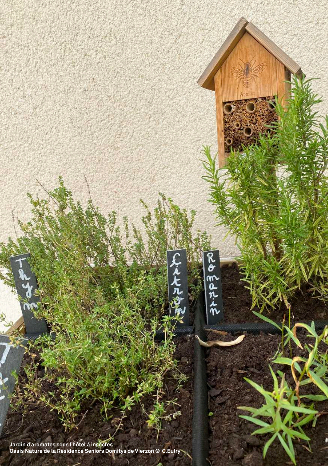
Jardin d'aromates sous l'hôtel à insectes Oasis Nature de la Résidence Seniors Domitys de Vierzon