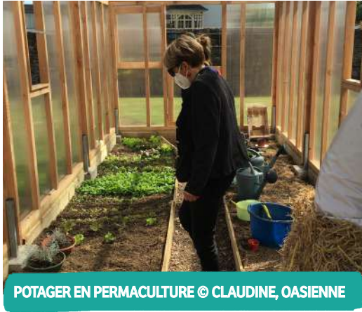
POTAGER EN PERMACULTURE