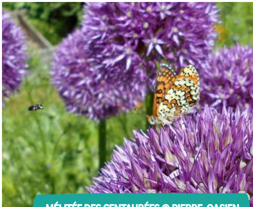
MÉLITÉE DES CENTAURÉES © PIERRE, OASIIEN