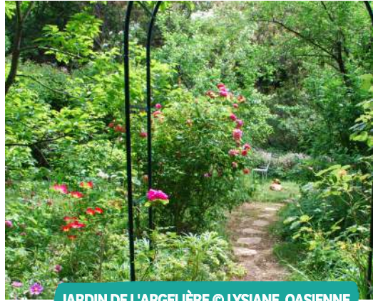
JARDIN DE L'ARGELIÈRE