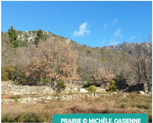
PRAIRIE © MICHÈLE, OASIIENNE