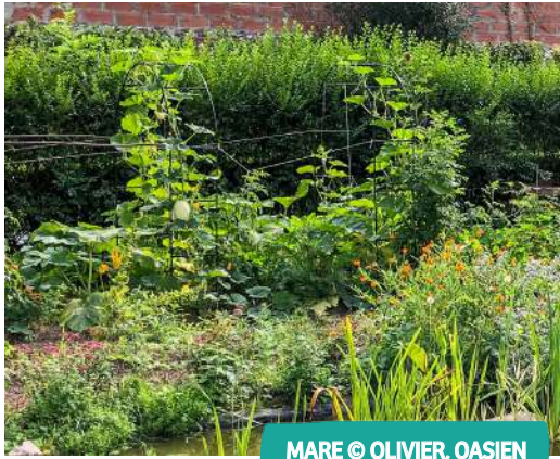
MARE © OLIVIER, OASIEN