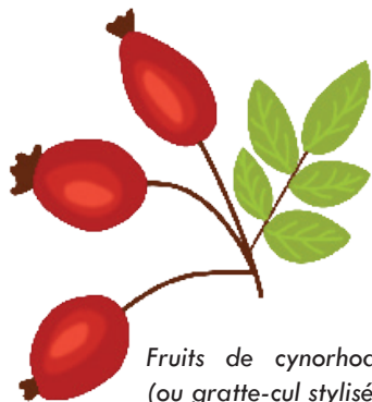
Fruits de cynorhodon (ou gratte-cul stylisé...)