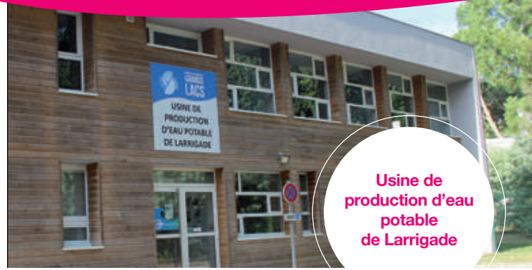
Usine de production d'eau potable de Larrigade