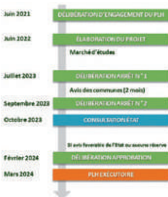
Schéma général de procédure et calendrier indicatif