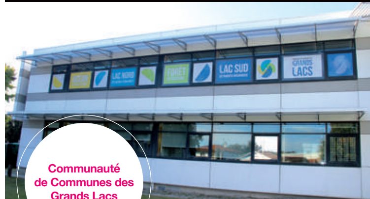
Communauté de Communes des Grands Lacs