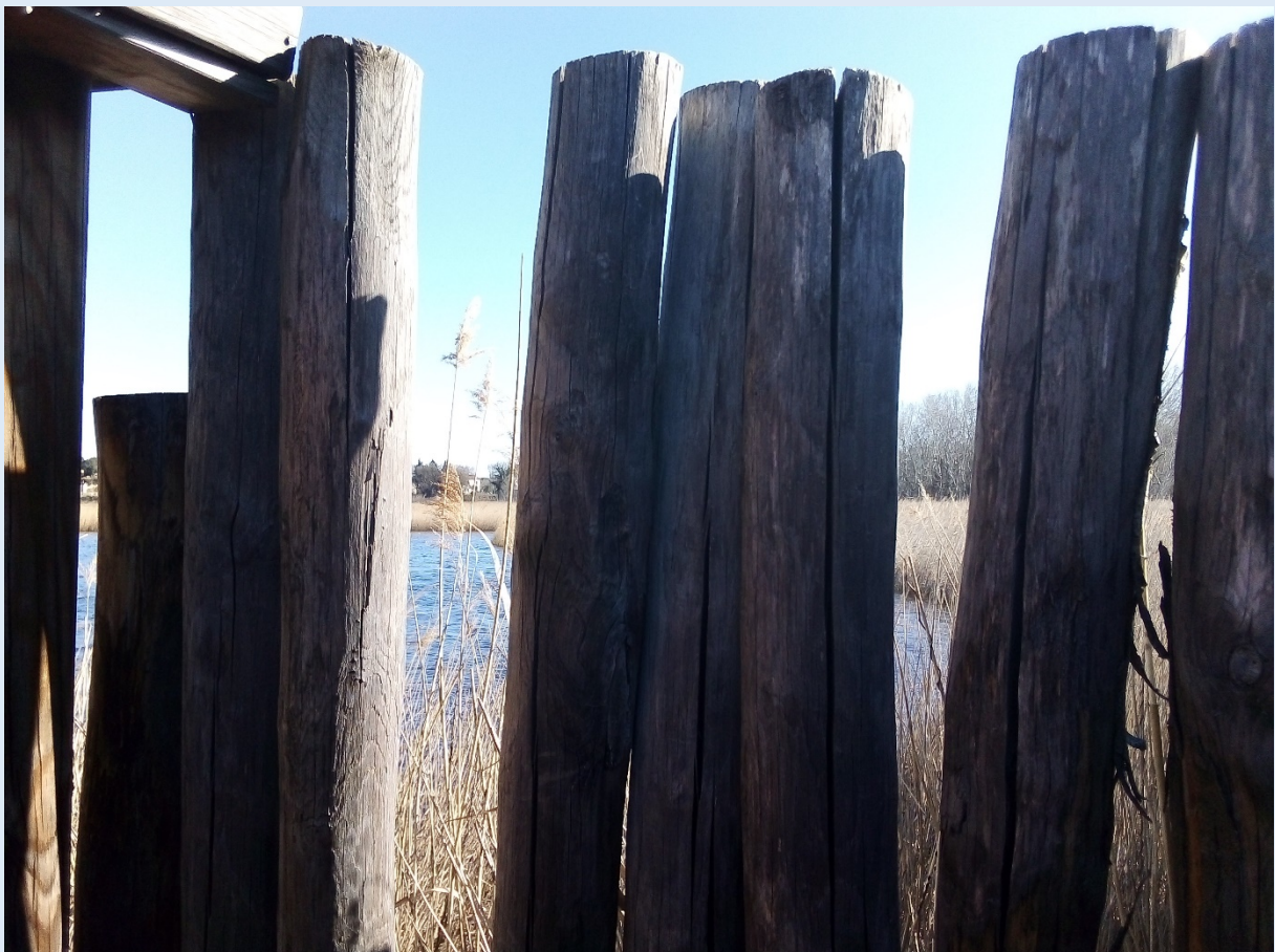
Photo de l'étang salé à peine lisible afin que ces deux fervents naturalistes le rendent à vos yeux visible ...

Tous deux partiront au même moment, quoi que ... pour deux balades différentes, bien que ... dans des directions opposées , mais pas que ... pour au final se rejoindre en votre compagnie, autour des mots ça, c'est certain.