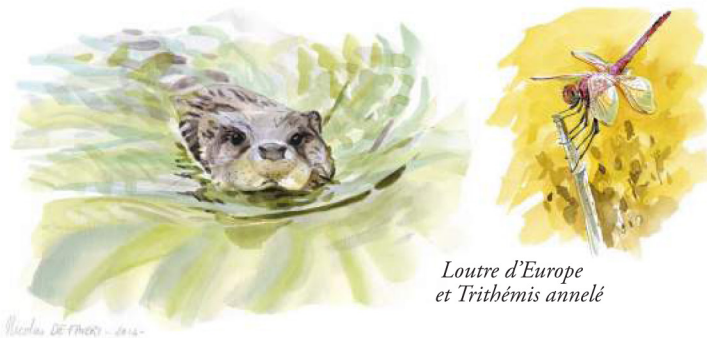
Loutre d'Europe et Trithémis annelé

D'une superficie de 102 hectares, la Réserve Naturelle est composée d'un ancien bras de la Garonne, de deux plans d'eau issus de la restauration d'anciennes gravières, ainsi que d'une mosaïque de milieux associés : cours d'eau, boisements humides, roselières, prairies et mégaphorbiaies constituent un attrait certain pour la biodiversité.