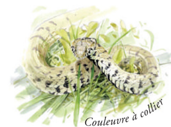
Couleuvre à collier

Vous y trouverez des diaporamas, les inventaires faune et flore ainsi que la vidéo de présentation de la Réserve Naturelle, vue du ciel.