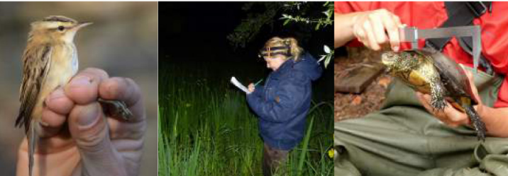
Suivis scientifiques : baguage des oiseaux, suivis amphibiens et Cistude d'Europe