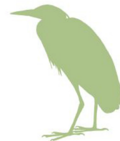
Aquarelles : avec l'aimable autorisation de N. de Favéri