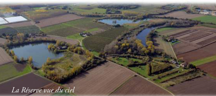
La Réserve vue du ciel

Grâce à une réglementation adaptée respectant le contexte local, la faune et la flore y sont préservées.