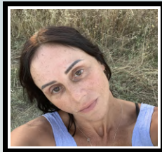
Katia MEYNIEL Artiste-photographe, poésie visuelle