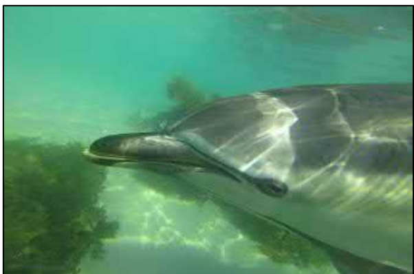
Sauvetage d'un dauphin commun ( Delphinus delphis ), réalisé à la plage de Perharidy en août 2021.

Protection contre le vent, la pluie et le soleil, chaussures pour marcher dans l'eau (si souhaité, apporter le nécessaire de baignade: maillot de bain, serviette) et son pique-nique & récipients pour déchets.