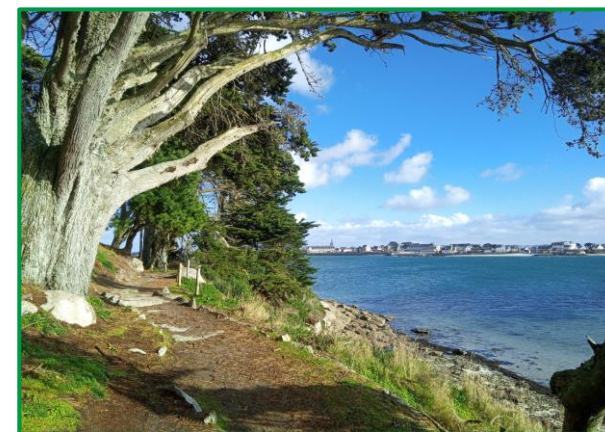
Sentier de Perharidy, vue sur Roscoff