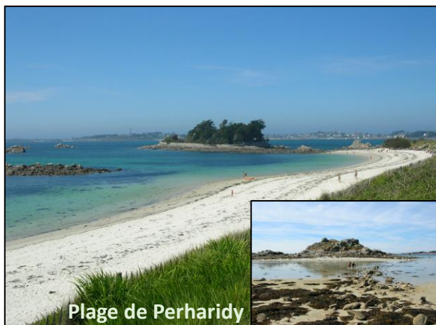
Plage de Perharidy