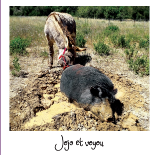
Jojo et voyou

"botanique" AVEC LES SENTIERS D'INTERPRÉTATION DES PLANTES