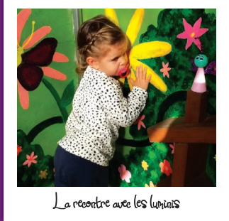
La rencontre avec les luminis

GROUPES Des ateliers et ressources pour vous accompagner dans la sensibilisation des plus jeunes aux enjeux du développement durable et donner envie de respecter et de protéger la planète. (Au jardin Forever ou dans les structures volontaires.)