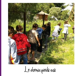
Le chemin pieds nus

ADULTES Découvrir la flore au travers de 2 sentiers: -"Les belles généreuses" sur les utilisations et les bienfaits quotidiens des végétaux; -"Les belles spontanées" du midi, plantes de garrigue et de maquis. (nécessite un lecteur QRcode)