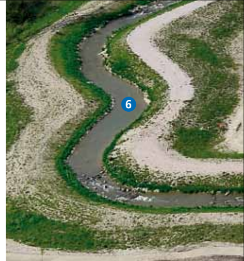
Une passe à poissons naturelle conçue comme une vraie rivière.

A l'amont, une plateforme regroupe la sortie piscicole, là où la passe à poissons rejoint le Rhin, et la prise d'eau qui alimente la microcentrale via une conduite forcée souterraine.